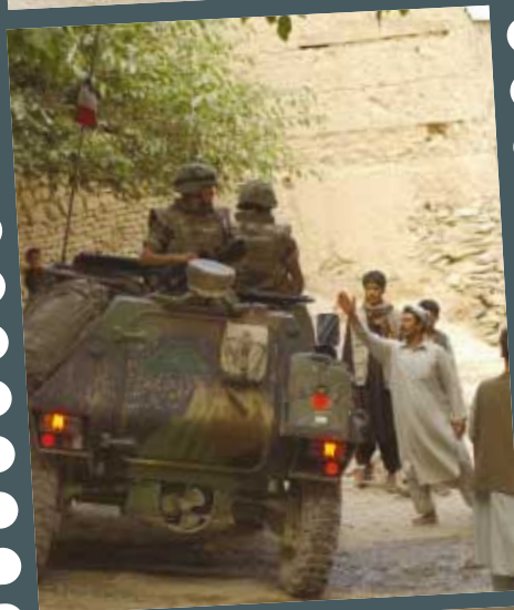
RETEX et prospective : Espoirs et limites du "droit d'ingérence" - p. 25 SIRPA TERRE