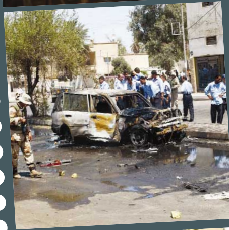
RETEX et prospective : De la guerre moderne : permanences et ruptures p. 15 US ARMY