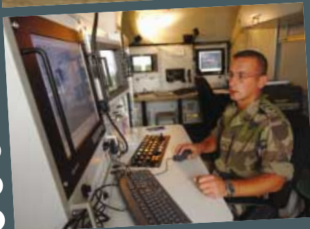
Penser l'adaptation de notre système de forces terrestres - p. 30 SIRPA TERRE