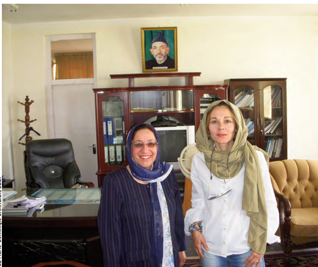
Réunion chez le gouverneur de la province de la Kapisa avec une Polad traductrice Afghane de la MINUA. (Mission internationale pour l'Afghanistan des Nations Unies).

CONSEILLER POLITIQUE AUPRÈS DU GÉNÉRAL COMMANDANT LES FORCES DE LA FIAS EN AFGHANISTAN DE FÉVRIER À AOÛT 2008