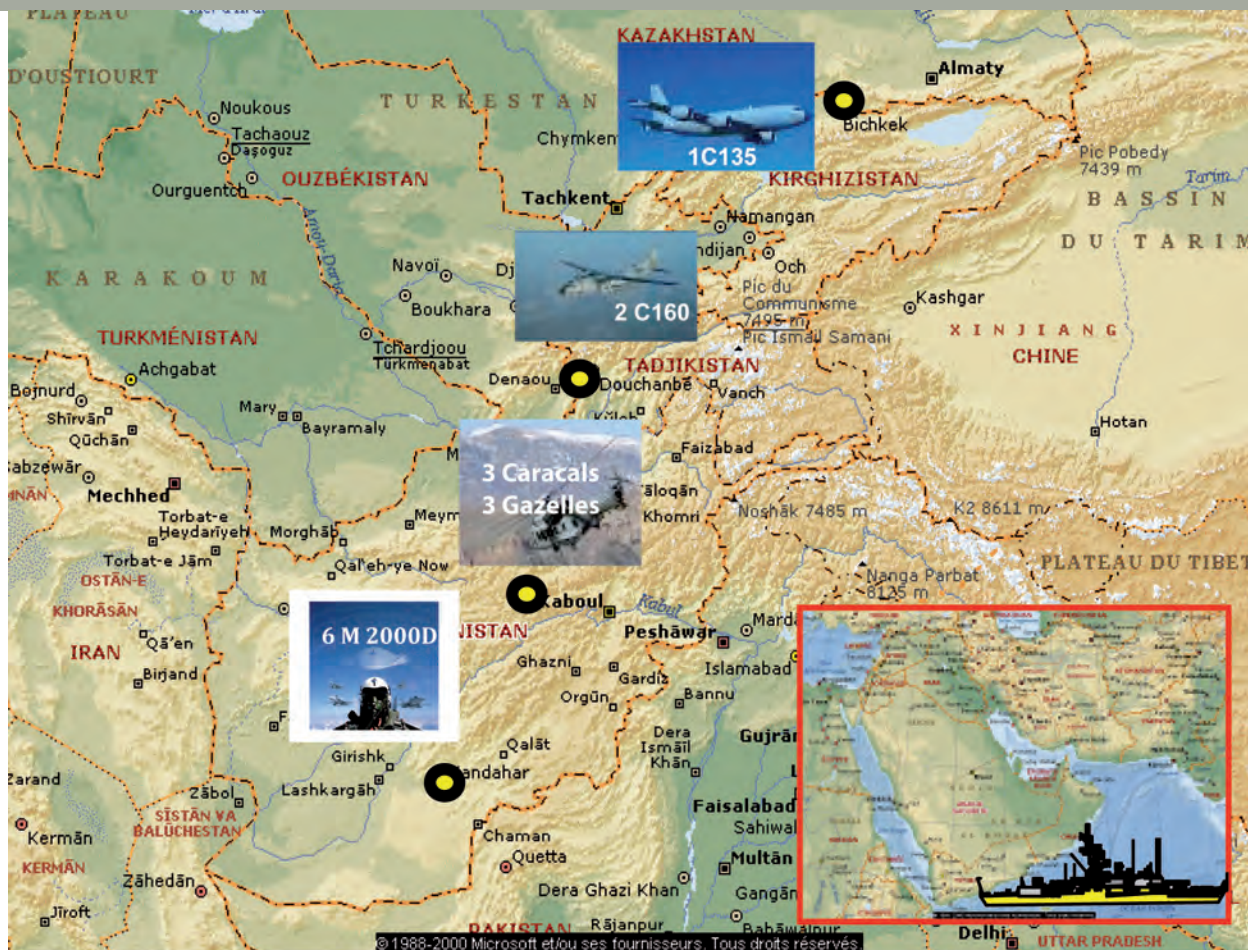
Les composantes aériennes ISAF et OEF et le dispositif maritime français